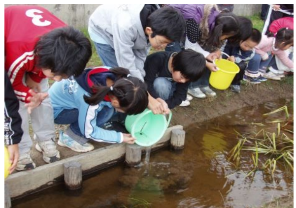
子供達によるメダカの放流