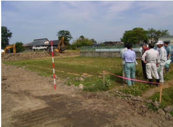
ほ場整備事業で土地の創設