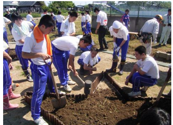
メダカ池造成（子供達も参加）